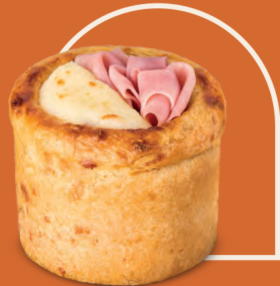
Mini Panettone Salgado Presunto Royale e Requeijão Cremoso

Uma releitura surpreendente do clássico panettone em versão salgada e irresistível. Assado até atingir uma textura dourada, é perfeito para servir como entrada, lanche ou como uma opção diferenciada em qualquer refeição.