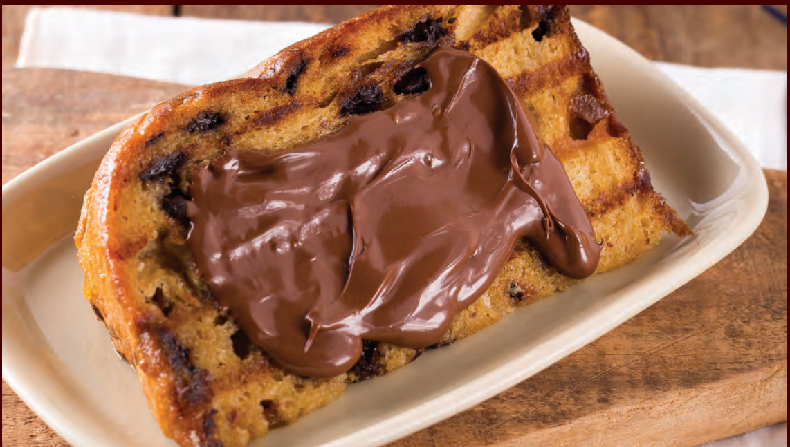
Fatia de Chocottone® Clássico + Creme de Avelã