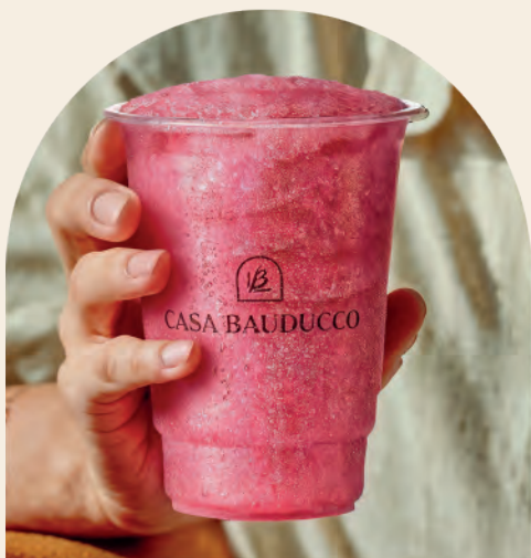
Granita Cereja Silvestre

A granita é uma tradicional bebida gelada italiana com textura cristalizada. Servida bem gelada, é perfeita para os dias quentes.