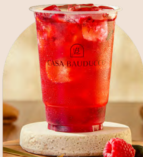
Soda Italiana Frutas Vermelhas