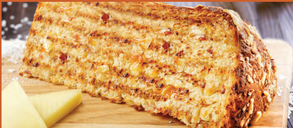
Fatia Salgada Clássica