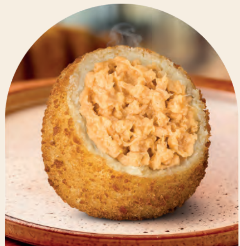
Arancini Frango e Requeijão Cremoso

Com frango temperado e requeijão, traz cremosidade e sabor marcante. Uma combinação sofisticada que une textura, aroma e sabor em cada mordida.