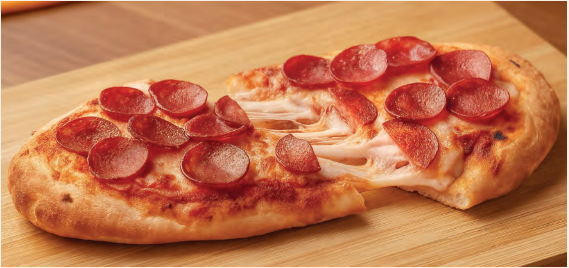
Pinsa Romana Calabresa