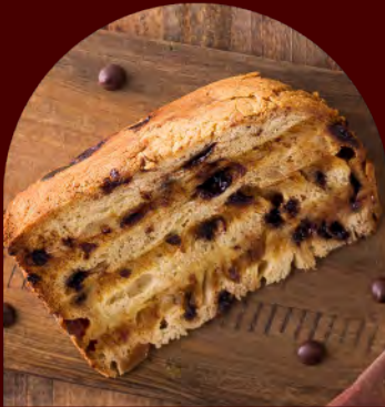
Fatia de Chocottone® Clássico