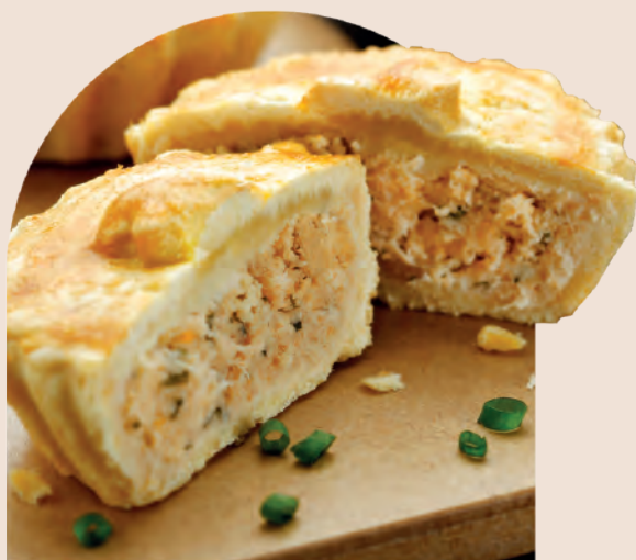
Tortinha de Frango com Requeijão