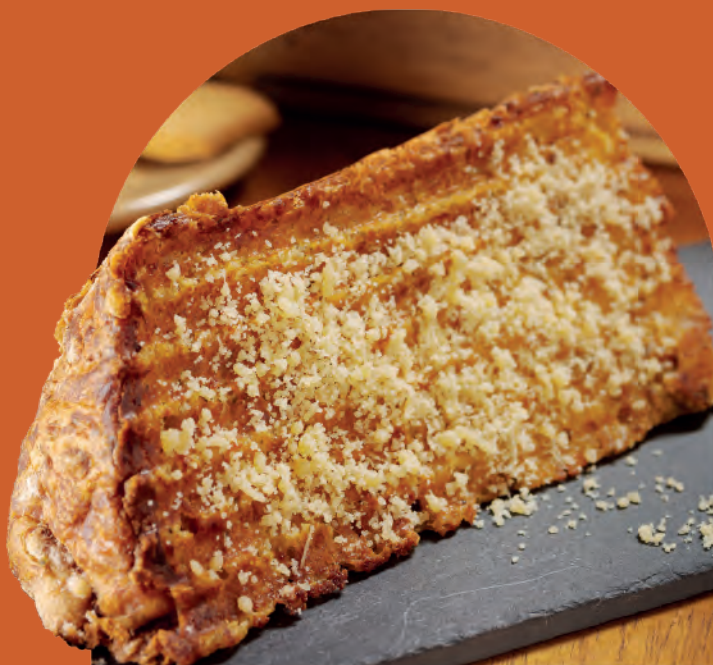
Fatia Salgada 3 Queijos