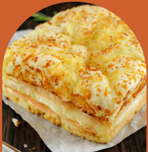
Toast Pão Focaccia Peru e Queijos

Pão de forma branco, muçarela e presunto