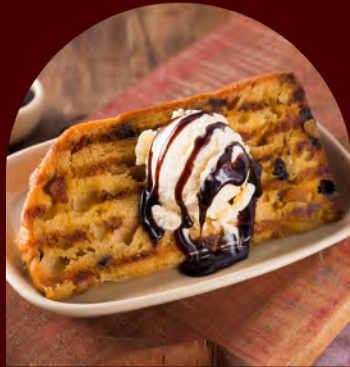
Fatia de Panettone Clássico + Sorvete