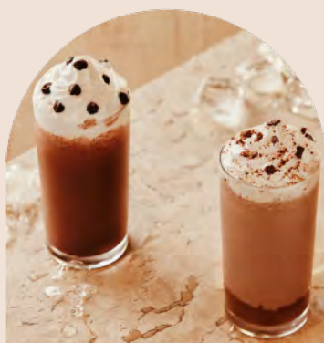
Latte Gelato Chocrocante e Latte Gelato Cioccolato