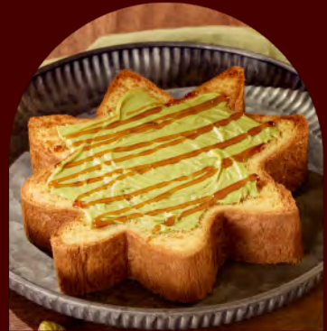
Fatia de Pandoro + Creme de Pistache