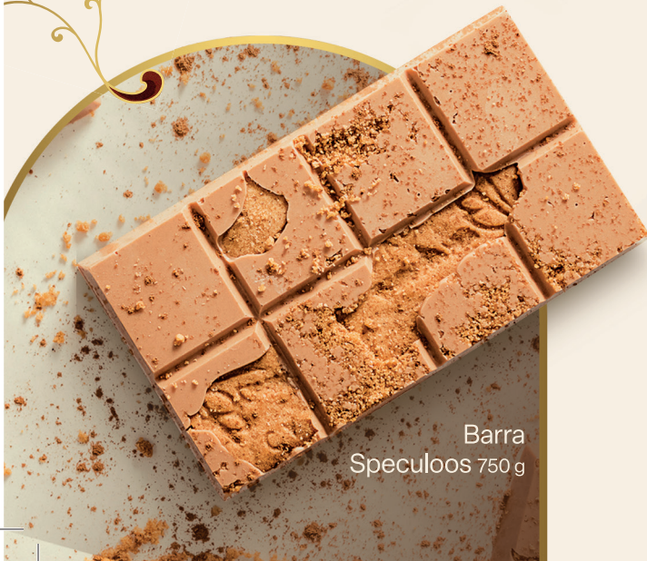
Barra Speculoos 750g