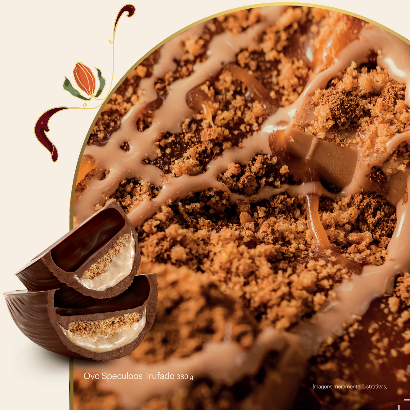
Ovo Speculoos Trufado 380 g