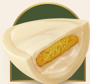
Ovo Metadinha Limão Siciliano