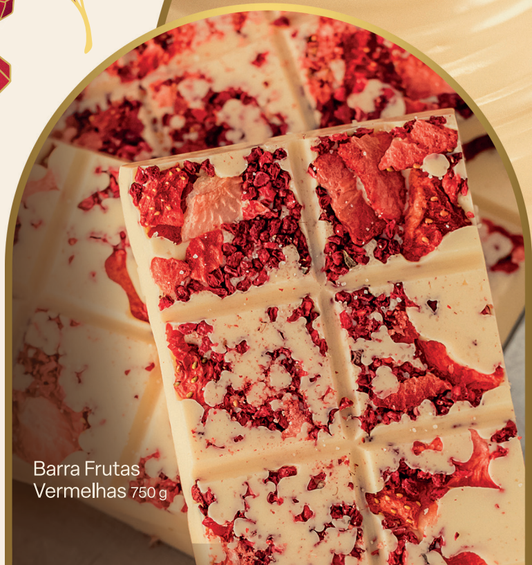
Barra Frutas Vermelhas 750 g