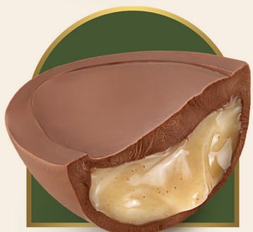
Ovo Metadinha Avelã