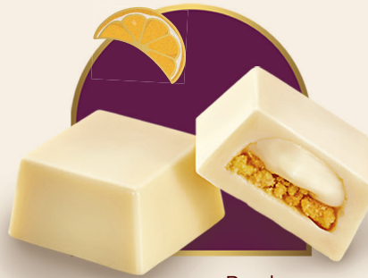
Bombom Limão Siciliano