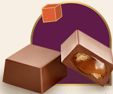
Bombom Caramelo Salgado e Palmier