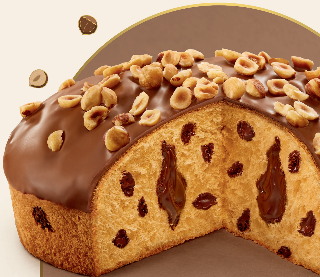
Chokolomba® Avelã 750 g