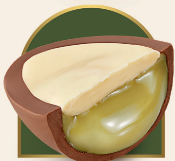
Ovo Metadinha Pistache