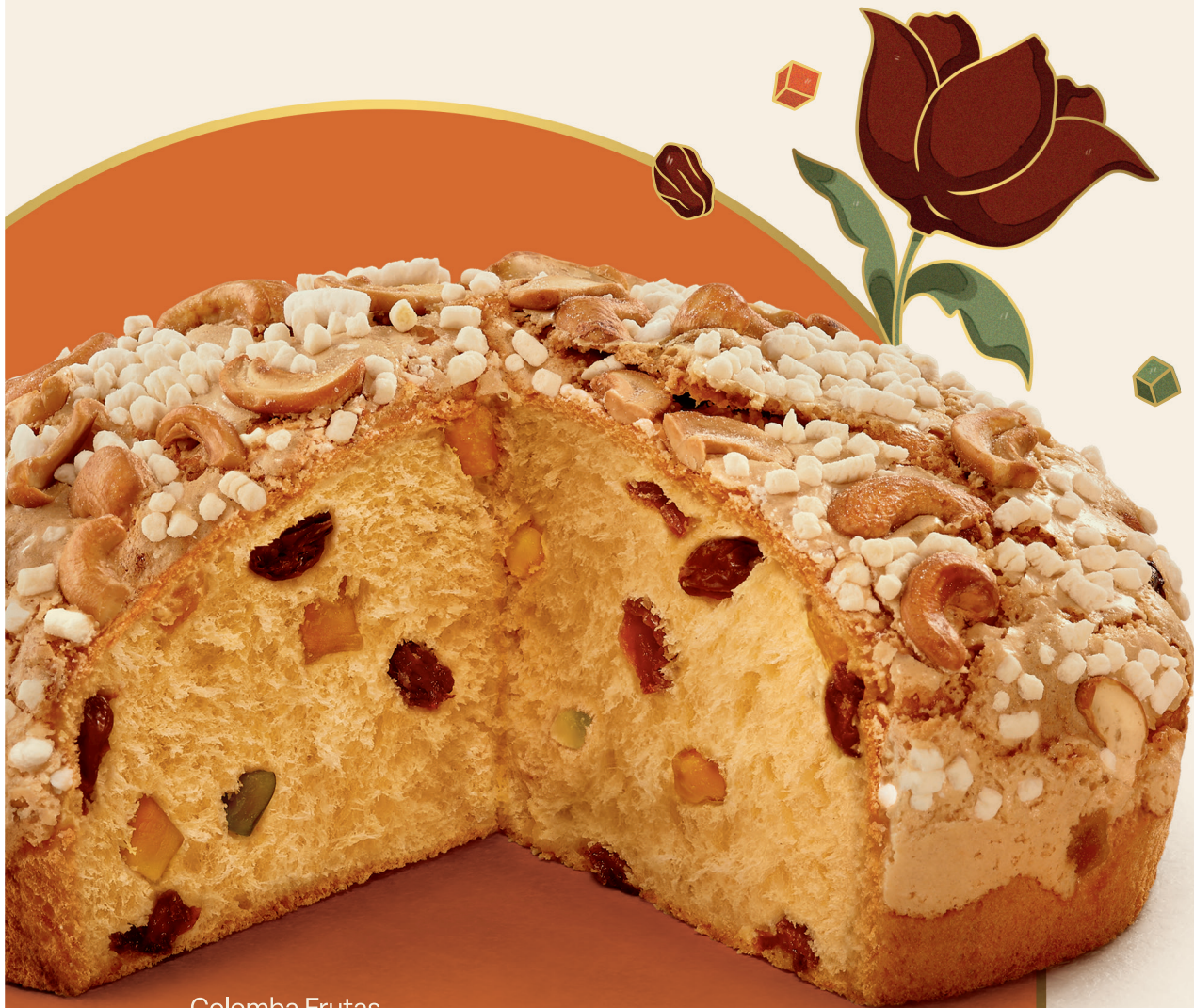
Colomba Frutas Cristalizadas 500 g