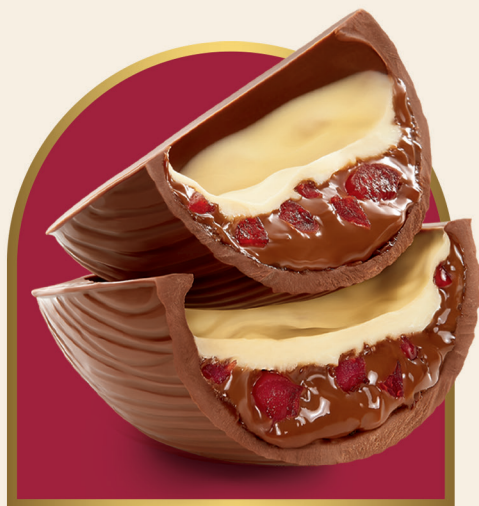
Ovo Cereja Trufado 360 g